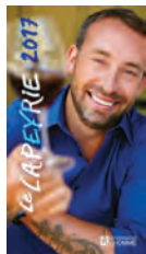
LE LAPEYRIE 2017 Les éditions de L'homme