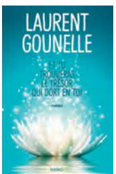
ET TU TROUVERAS LE TRÉSOR QUI DORT EN TOI Laurent Gounelle