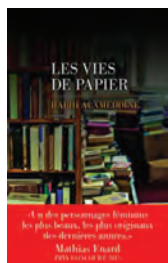
LES VIES DE PAPIER Rabih Alameddine