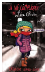
LA VIE COMPLIQUÉE DE LÉA OLIVIER Catherine Girard-Audet