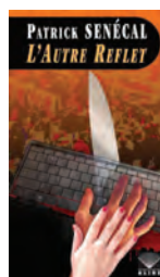
L'AUTRE REFLET Patrick Senécal