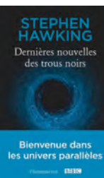
DERNIÈRES NOUVELLES DES TROUS NOIRS Stephen Hawking

VOUS AIMEZ LIRE? INVITATION À VENIR PARTAGER VOS LECTURES AVEC D'AUTRES PASSIONNÉS.