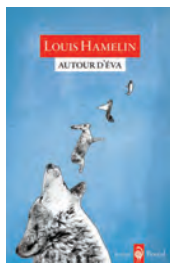
AUTOUR D'ÉVA Louis Hamelin